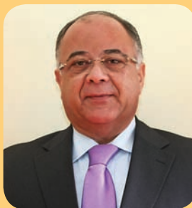
O Presidente do CLAST,

A firmeza para o futuro mantém-se! E é com base nesta certeza que continuaremos afincadamente a trabalhar para conseguir mais e melhor para este concelho e para as pessoas de que tanto nos orgulhamos, deste nosso Vale Encantado.