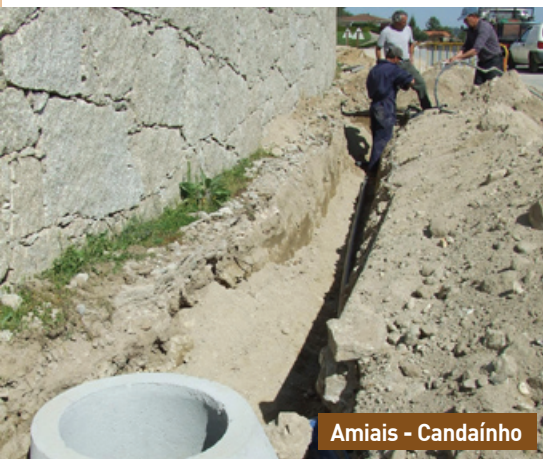
Amiais - Candaíno